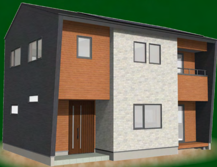
※パースはイメージです